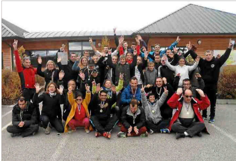
■ Avec les Olympiades de l'intégration, le sport reste un vecteur essentiel d'intégration.

Sur l'invitation d'une association de Marvejols, le groupe a trouvé au cours d'un entraînement commun de judo, un accueil chaleureux où 53 sportifs ont pu échanger sur les sports d'opposition à des niveaux différents certes, mais dans une bonne ambiance de travail. L'intégration a trouvé tout son sens dès le lendemain, au cours des activités mises en place par les éducateurs sportifs du centre de Montrodat, spécialisés dans les activités sportives à destination des personnes à mobilité réduite. Le but était de pratiquer tous ensemble des activités tout en effaçant un instant le handicap. Mieux encore en prêtant son handicap à l'autre, et en