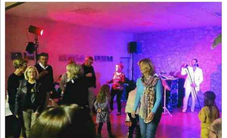
■ Le foyer rural a placé un jalon très positif pour l'an prochain.

Samedi 22 octobre le plein de réservations était largement atteint, tant la réputation de la soirée châtaigne n'est plus à faire. Certes, le ciel avait revêtu son manteau automnal obligeant les organisateurs à prévoir une extension en toile étanche. Le menu proposé a su sensibiliser les papilles les plus déli-