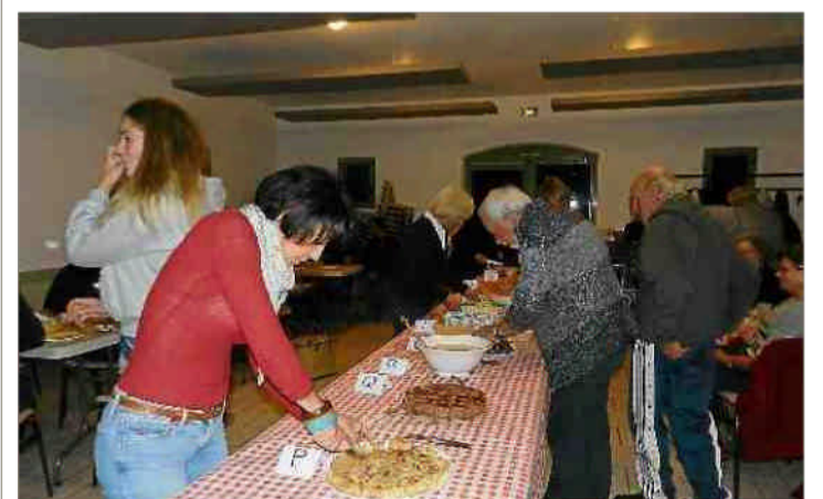
■ Prochain rendez-vous le samedi 17 décembre pour fêter Nadalet.

Chaque année, à l'automne, les Braves enfantous convient la population de Rieussec à participer à un concours de soupes. Cette année, l'association a voulu innover : soupe à l'oignon pour tout le monde, suivie d'un concours de desserts ! Pas moins de quatorze préparations soumises à l'appréciation de l'assemblée et,