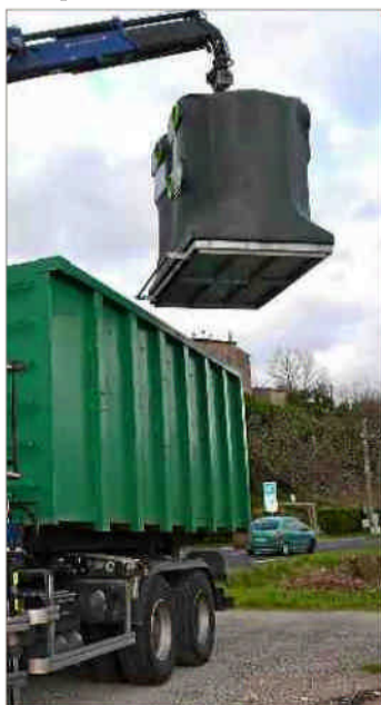
■ Un investissement qui vise à améliorer la collecte.

Dernièrement, la communauté de communes Grand Orb s'est équipée de nouveaux conteneurs pour trier bouteilles et pots en verre. Cet investissement vise à améliorer la qualité du service de collecte et s'inscrit dans un plan pluriannuel. En avril 2016, à l'occasion du vote du budget du service Environnement, les élus communautaires ont validé la mise en place d'un plan pluriannuel d'investissement. Celui-ci vise à anticiper, d'une part, les remplacements de matériel comme les camions de collecte et, d'autre part, les travaux à mener sur les bâtiments (déchetteries, quais de transfert...). Les premières actions de ce plan sont en route, elles vont permettre de moderniser le service aux usagers en renouvelant notamment les conteneurs et les colonnes à verre. Ainsi, depuis quelques semaines, quatre nouveaux points d'apport volontaire